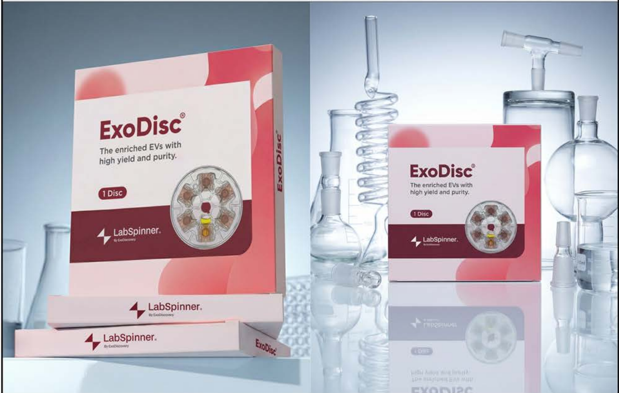
ExoDisc® 디자인 및 제작