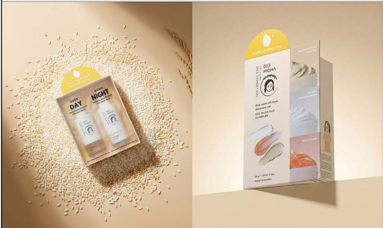
스킨 세트 디자인 개발